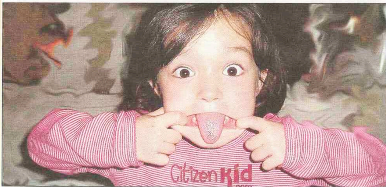
Avec citizenkid.com, participez à un concours de grimaces !

Kidexpo, c'est le royaume des enfants. Et qui dit enfant, dit jeu ! Le seul problème, c'est de réussir à tout faire !